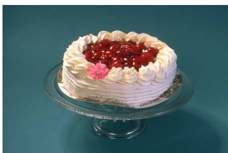
Kaffe og kake