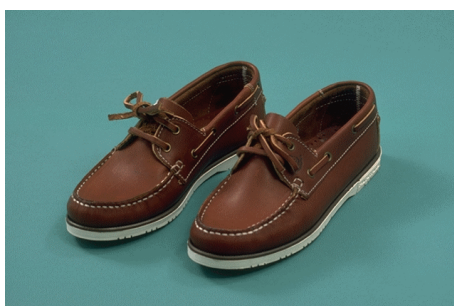
Sokker og sko