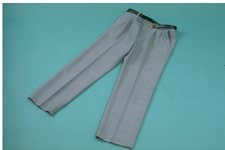
Skjorte og bukse