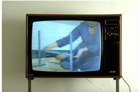
Radio og TV