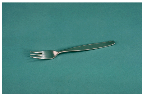
Kniv og gaffel