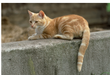
Hund og katt