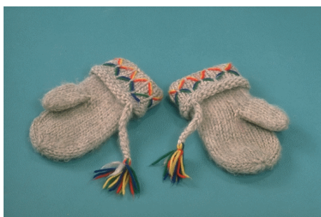
Skjerf og votter