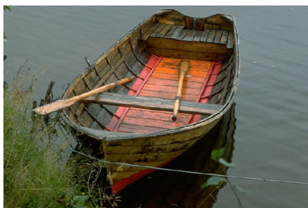
Bil og båt