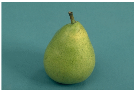
Eple og pære